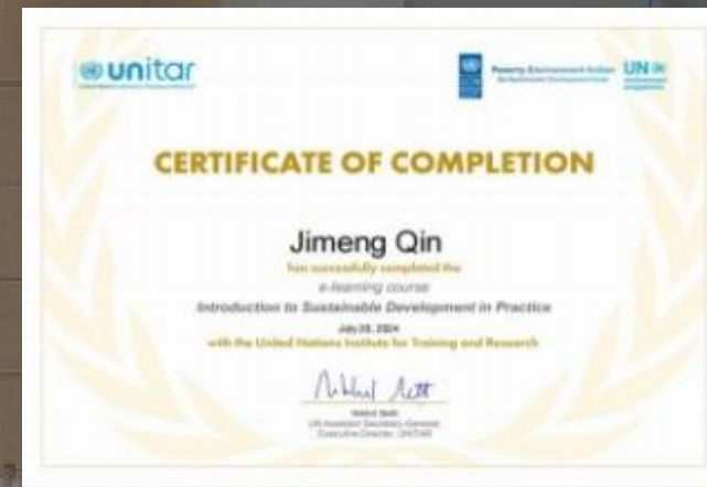
课程成绩证书样例